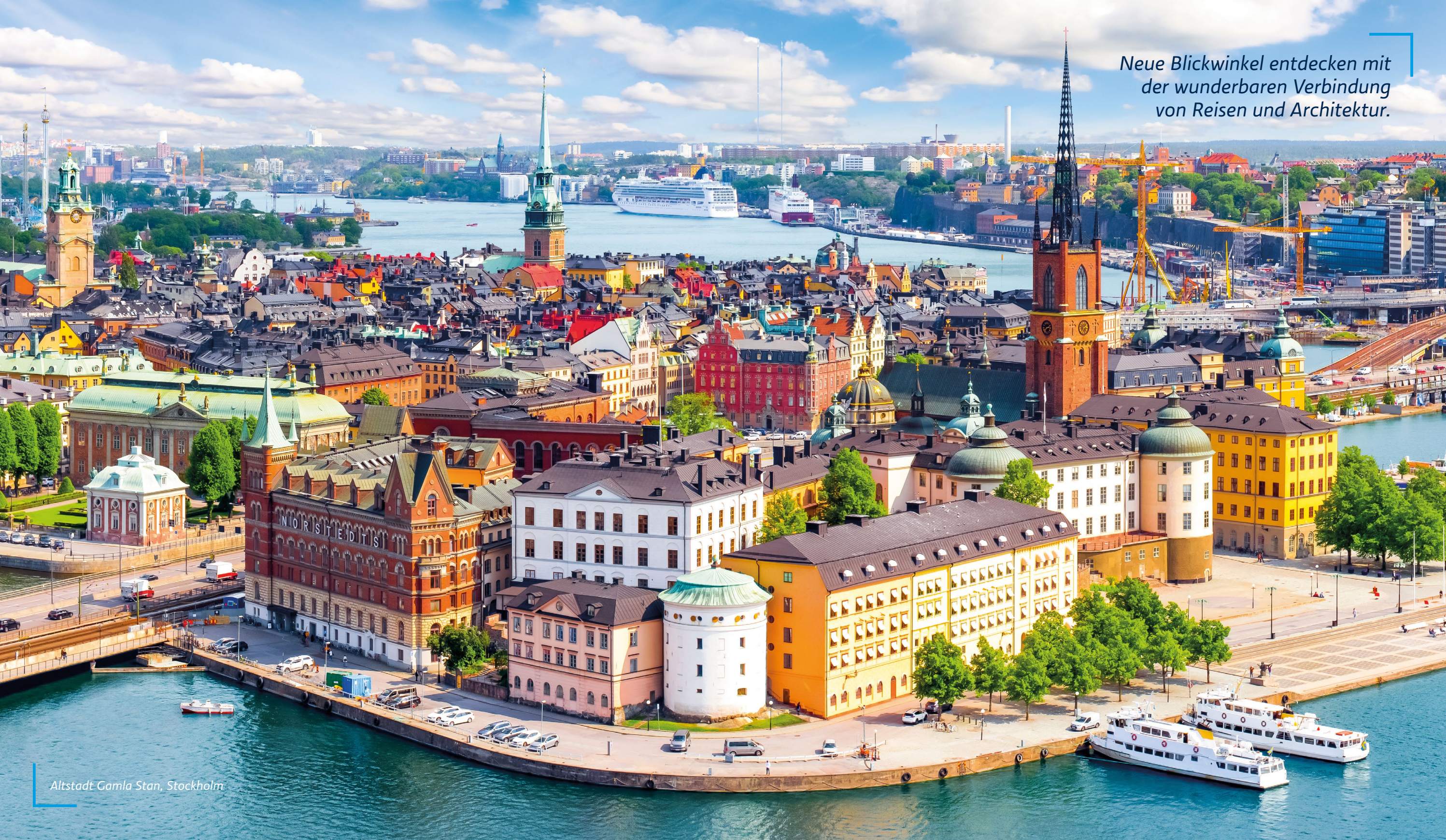
Altstadt Gamla Stan, Stockholm

Neue Blickwinkel entdecken mit der wunderbaren Verbindung von Reisen und Architektur.